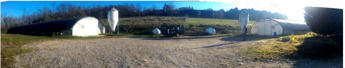
Ferme des Blains 26 St Martin des Rosiers

Vous trouverez ci-après les retours et constatations après 9 mois d'utilisation.